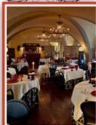
Salle du Marquis

→ pour vos comités de direction et séminaires