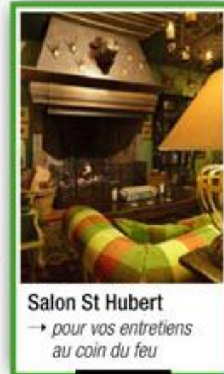
Salon St Hubert